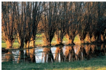
Saulles dans le Marais

mêlées de pluviers dorés et de mouettes rieuses. D'octobre à mars, on peut observer des nuées de vanneaux huppés migrants, fuyants les froids trop vifs. À l'approche d'un danger, les vanneaux émettent un cri d'alarme. Pour éloigner les prédateurs des jeunes non volants, les adultes simulent alors une blessure. Jusqu'au signal de fin d'alerte, les jeunes se plaquent à terre sans bouger, camouflés par leur plumage de la couleur du sol.